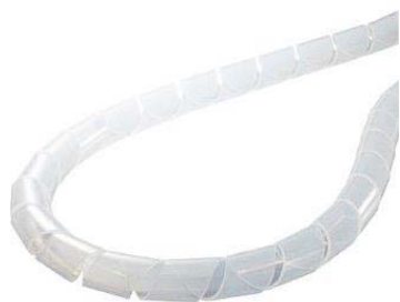
スパイラルチューブ(内径 10mm 程度)

●市販のスパイラルチューブ（電線保護用）や、●絶縁テープ（ビニールテープ） を巻きつけることにより、被覆の損傷を防止することができます。