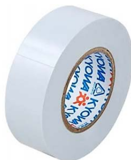
絶縁テープ(ビニールテープ)